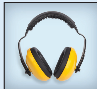
Orejas con protección auditiva