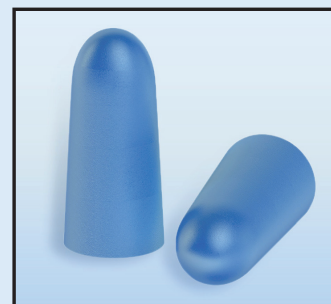
Tapones de espuma moldeables

Usar orejas y tapones de oídos juntos puede reducir aún más el sonido, lo que es ideal para entornos muy ruidosos como talleres de carpintería y eventos de tiro deportivo.