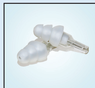
Tapones premoldeados de alta fidelidad