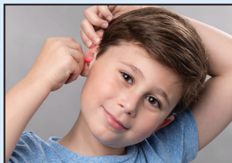
Jalar hacia atrás e insertar